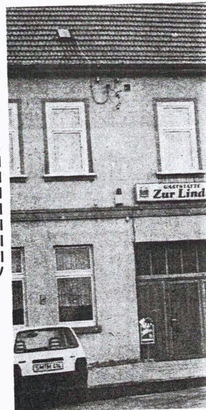
Ansichten eines Ortes: Die Büßlebener jährigen Kirmes. Bild rechts: Dringer

TEB Moderne Bauelemente Fertigung & Montage