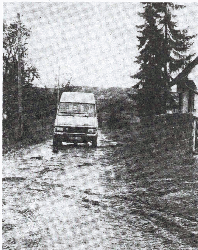
Sichten eines Ortes: Die Büßlebener Kirmesgesellschaft von 1951 (oben) und das Gasthaus zur Linde, zentraler Ort der diesjährigen Kirmes. Bild rechts: Dringend notwendig die Befestigung der Straßen.